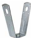
Laikiklis trapecijos formos