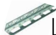
Perforuotas montažinis profilis RIP L2, cinkuotas