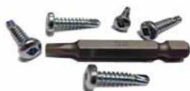
Savisriegis su kvadratinium rakteliu DIN 7504