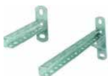
Atraminis kampas cinkuotas