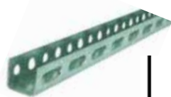
Perforuotas montažinis profilis RIP U2, cinkuotas